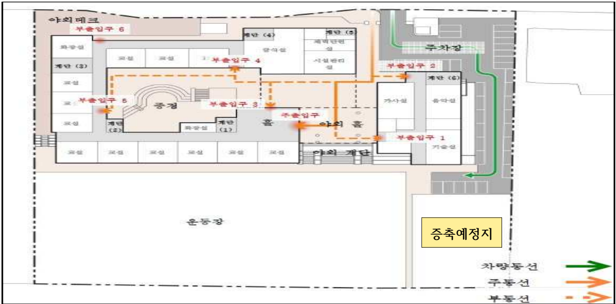
[그림-1] 신현중학교 건물 배치도 및 학생·차량 주요 동선