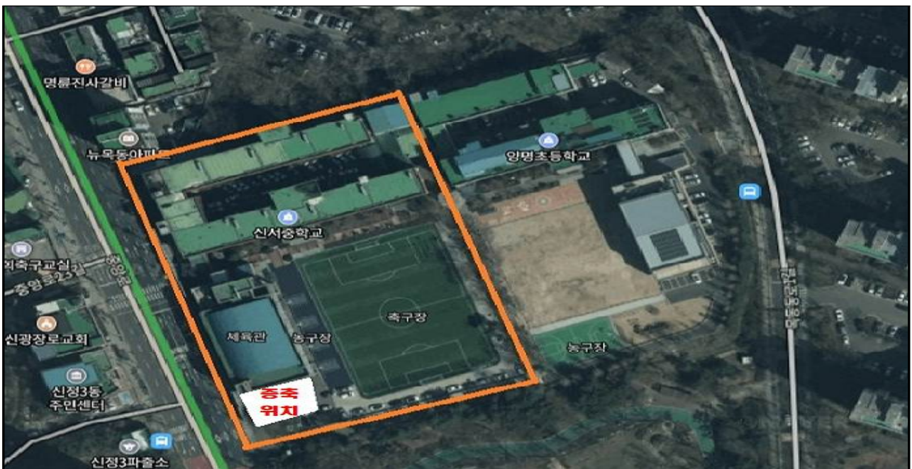
[그림-5] 신서중학교 현장 사진23)