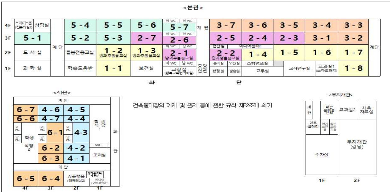
[그림-2] 서울안평초등학교 건물 및 교실배치도