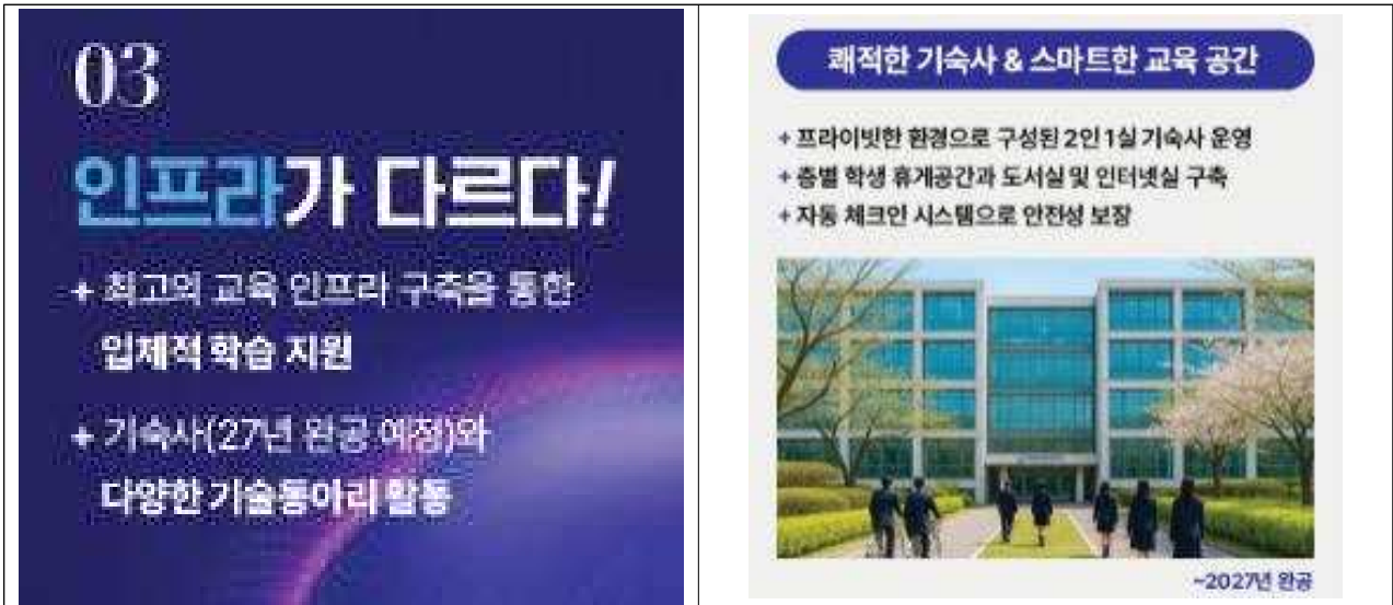
[그림-8] 2026년 신입생 모집 안내 자료 중 기숙사 관련 내용 60)

완공”을 공헌하는 등 용적률과 건폐율의 추가 확보보다 대외적인 홍보에만 몰두하였던 것으로 생각됩니다.