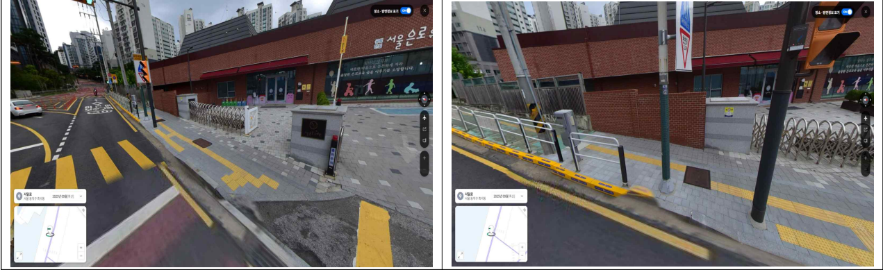
[그림-7] 기부채납 부지 현황도 42)